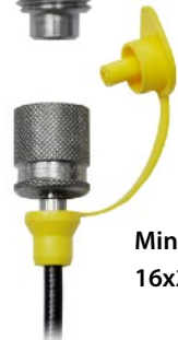
Minimes-Schlauch 16x2 (800 mm)

Aktionspreis: CHF 890.-/Stk. (exkl. MwSt.)